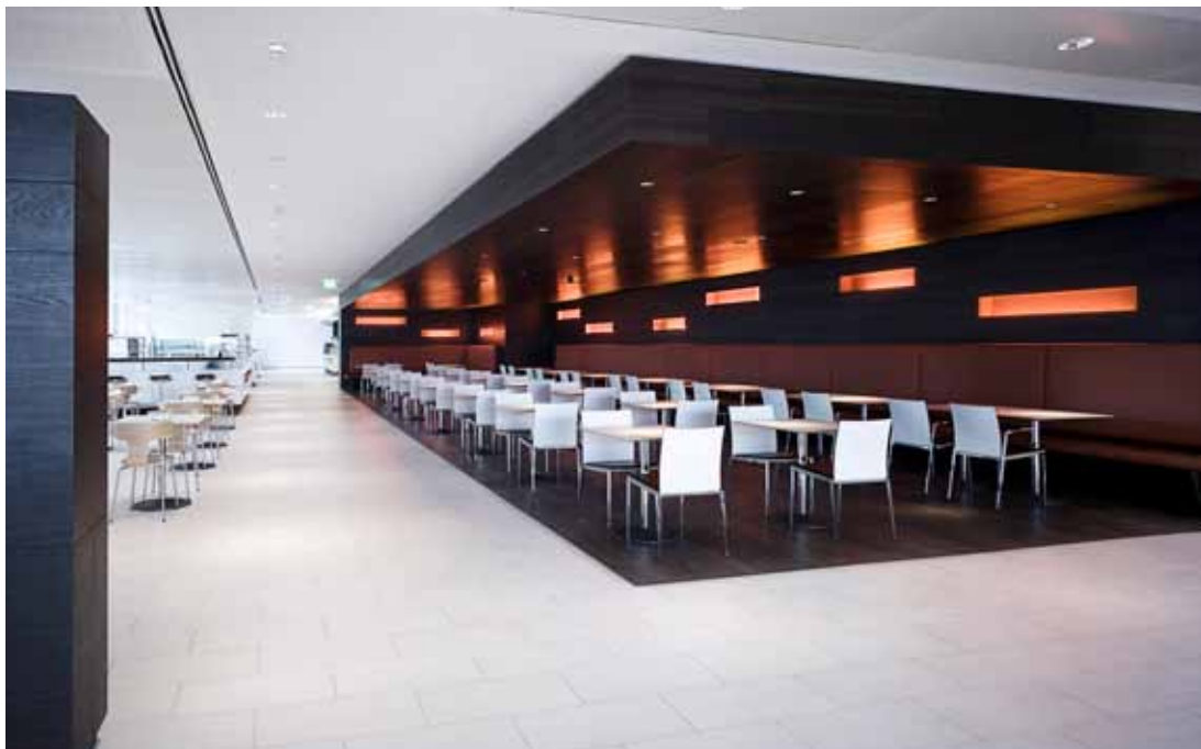
KFW Bank, Frankfurt, Deutschland J.S.K. SIAT International Architekten und Ingenieure, Frankfurt, Deutschland