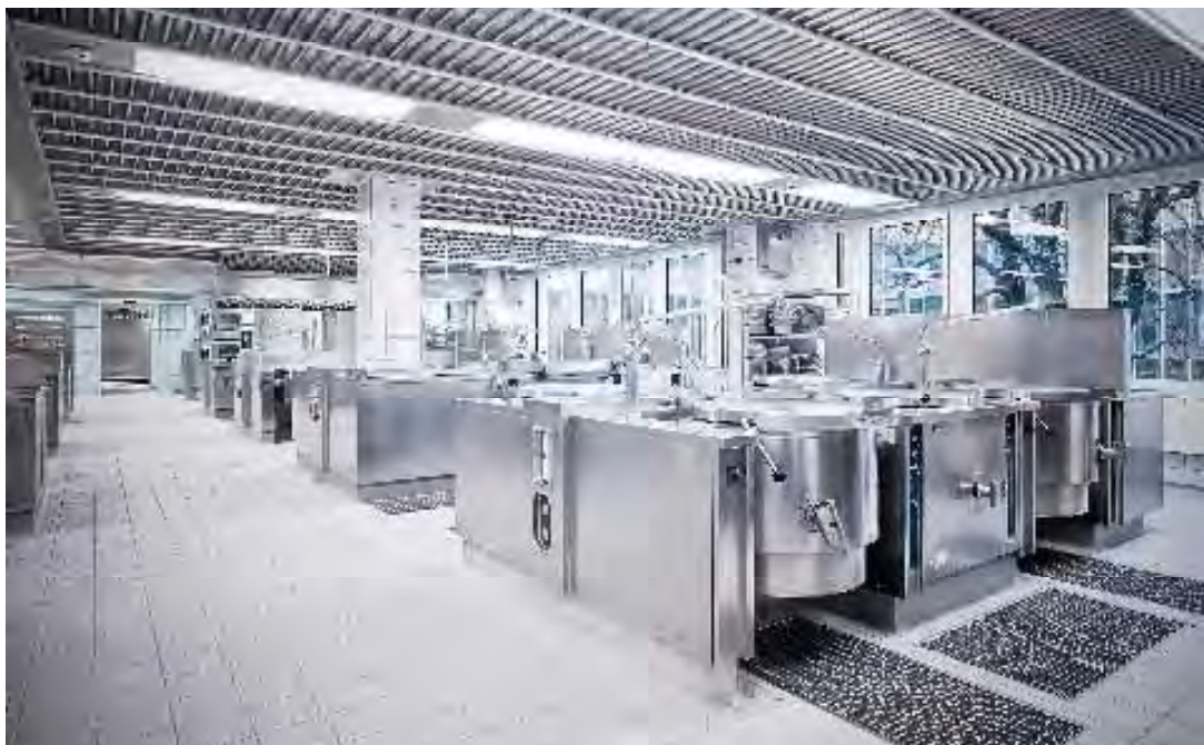
KFW Bank, Frankfurt, Deutschland J.S.K. SIAT International Architekten und Ingenieure, Frankfurt, Deutschland

Wartungs-, Inspektions-, Betriebs- und Pflegeanleitungen sind beigelegt.