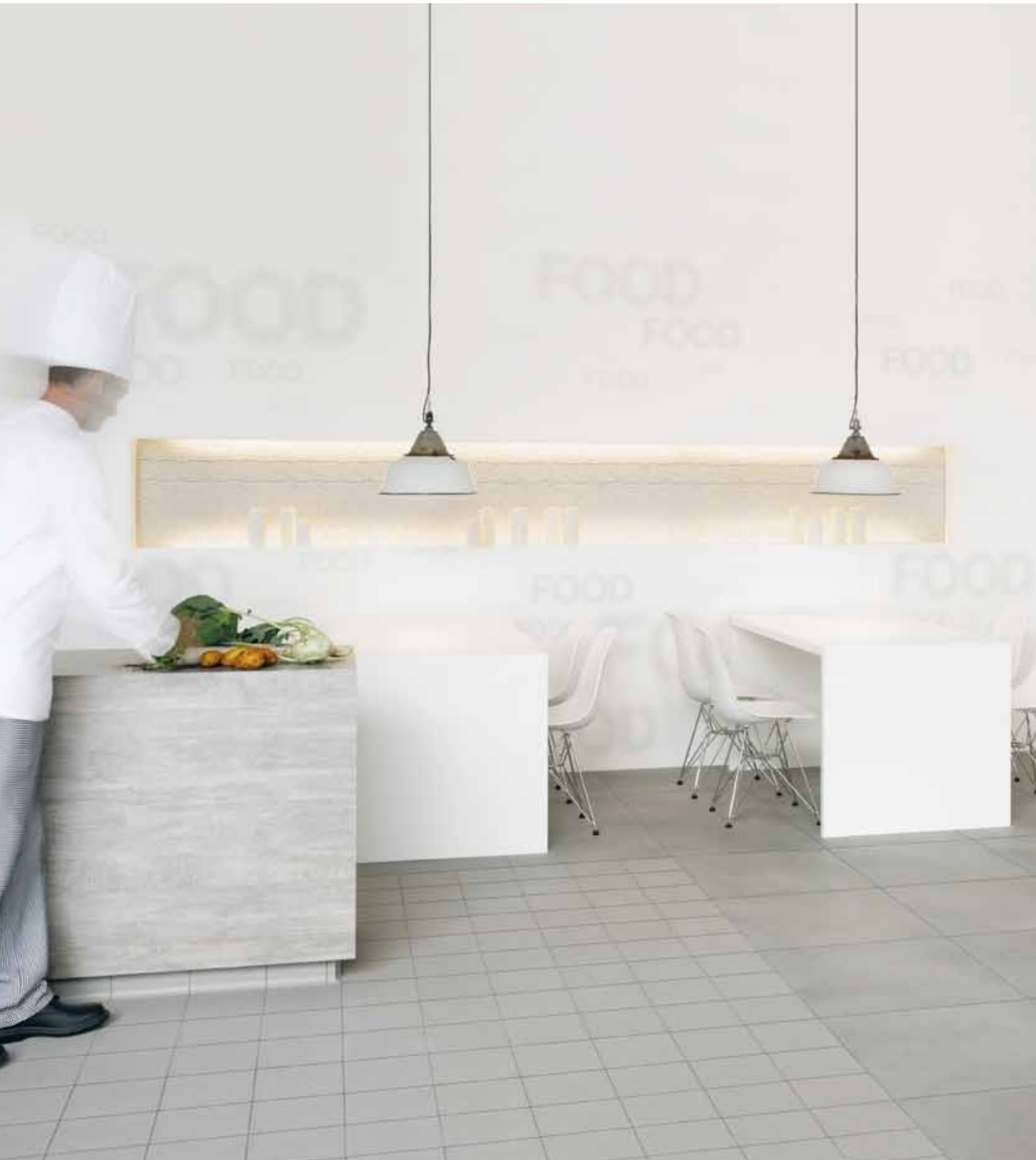
Studioaufnahme, Sylvia Leydecker, 100% interior, Köln, Deutschland