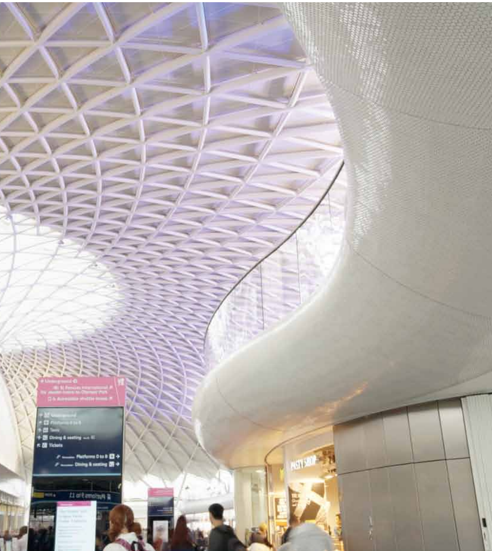
King's Cross Tube Station, London, Großbritannien John McAslan + Partners, London, Großbritannien