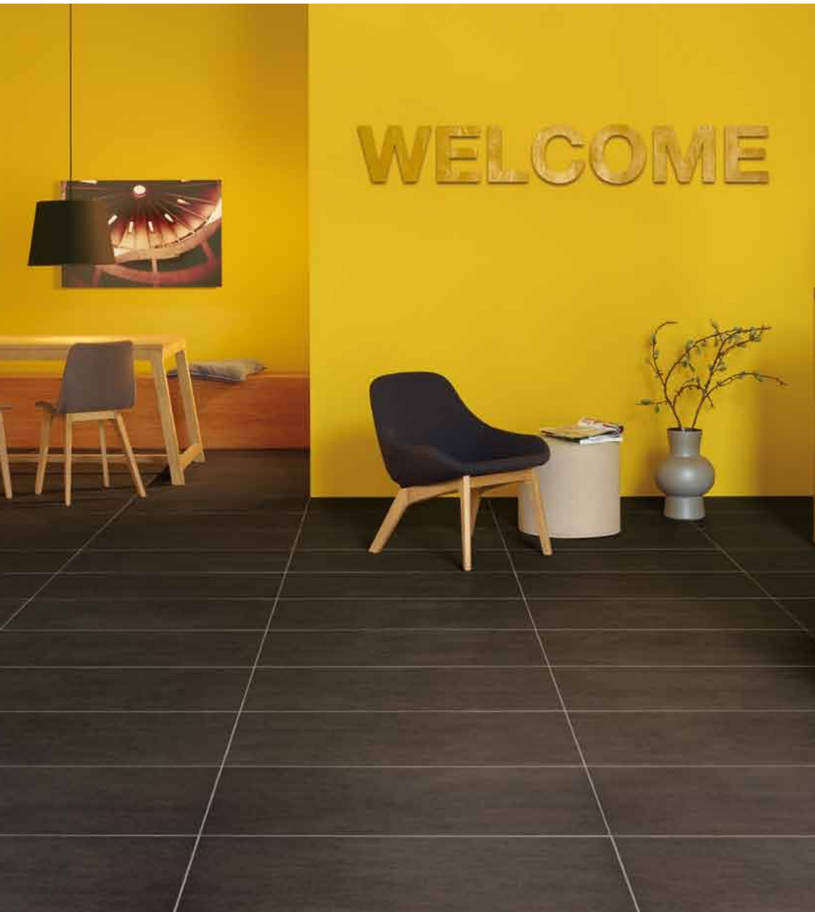
Studioaufnahme, Bianca Lautenschläger, Design In Architektur, Darmstadt, Deutschland