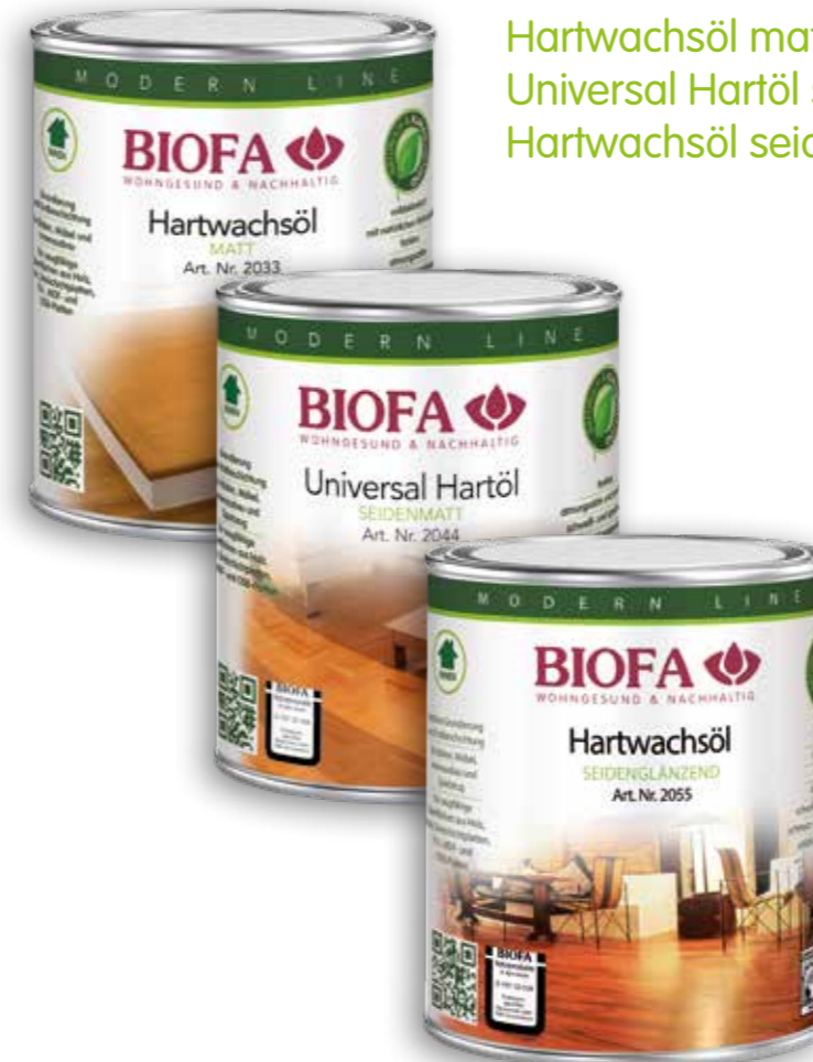
Hartwachsöl matt 2033 Universal Hartöl seidenmatt 2044 Hartwachsöl seidenglänzend 2055