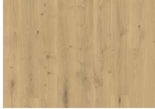
Kappadokien CLA 200