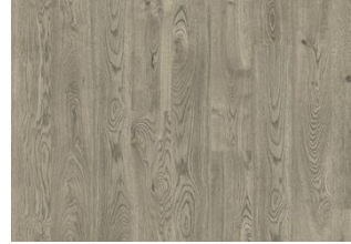
Jasper CLA 200