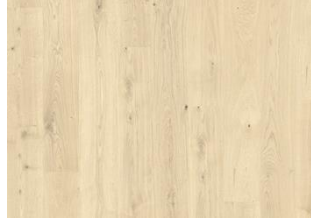
Bwindi CLA 200