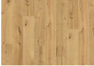
Grand Canyon CLA 200