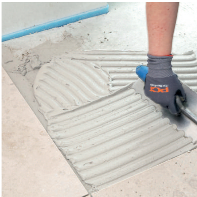
PCI Carrament® weiß ist ein plastisch-geschmeidiger Mittelbettmörtel und lässt sich leicht auftragen.

Eckfugen (Boden/Wand, Wand/Wand, Wand/Decke) und Anschlussfugen (Einbauteile/Plattenbelag, Holz/Plattenbelag) elastisch mit PCI Carraferm ausbilden.