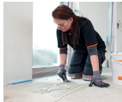
Mit PCI Carrament ® weiß können Naturwerksteinbeläge sicher im Mittelbettverfahren verlegt werden.