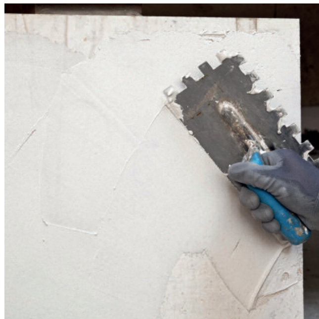
Zum hohlraumfreien Verlegen wird grundsätzlich eine Mörtelschicht auf die Plattenrückseite aufgetragen.