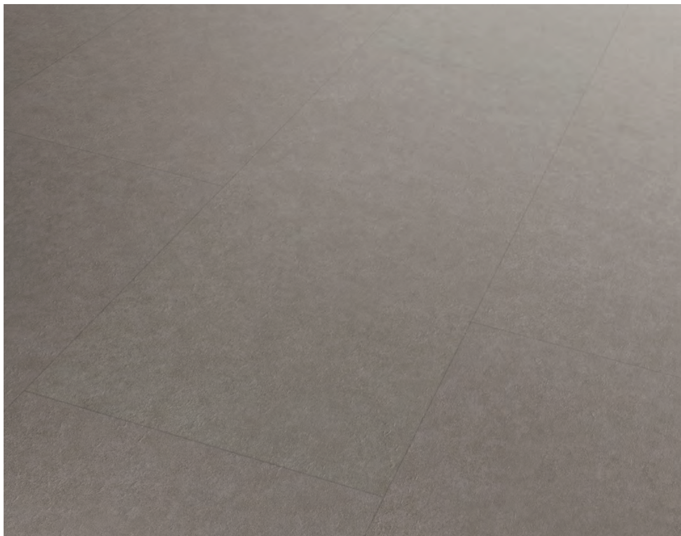
Sämtliche Abbildungen können farblich vom Originalprodukt abweichen.