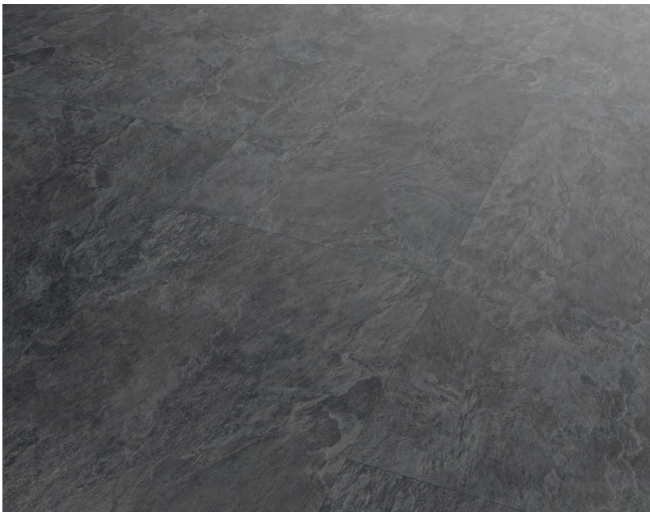
Sämtliche Abbildungen können farblich vom Originalprodukt abweichen.