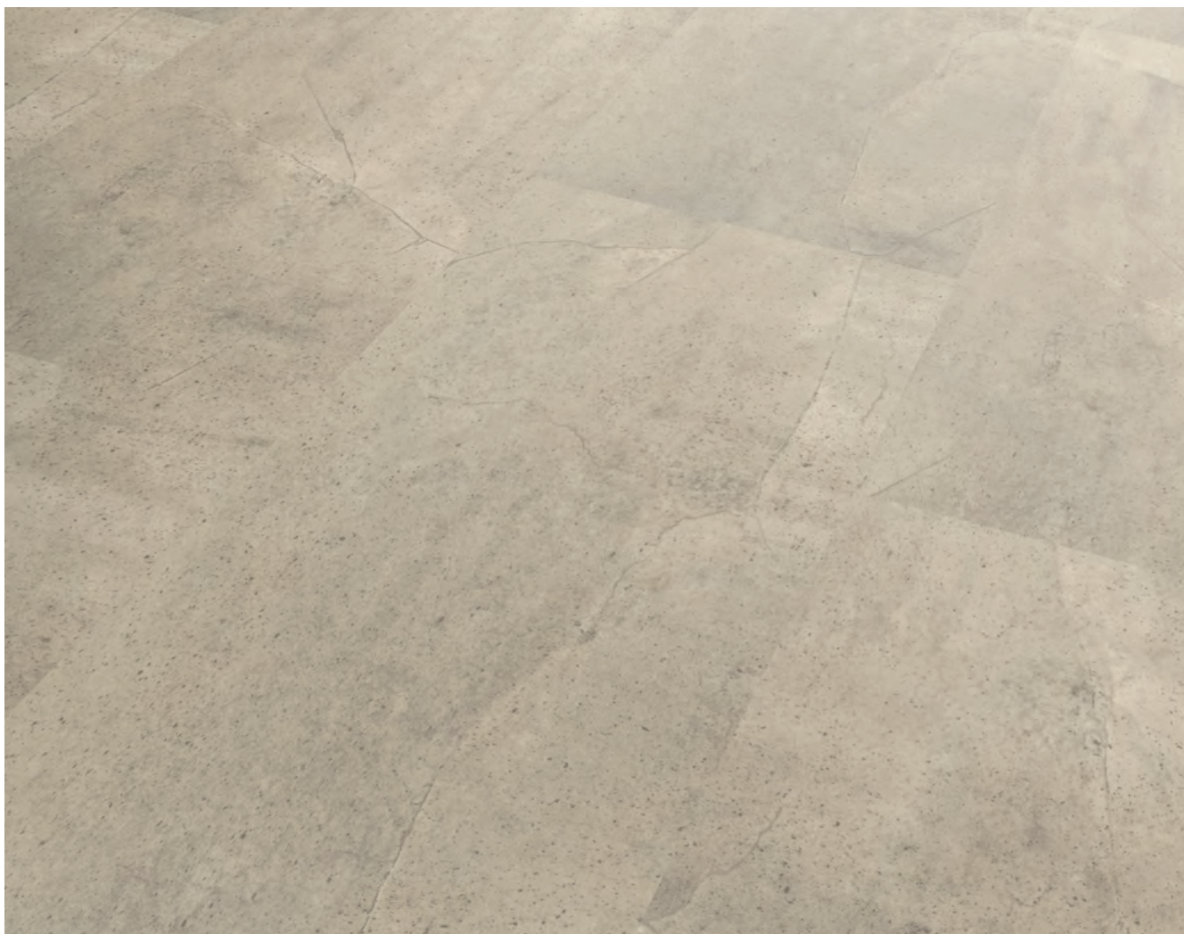
Sämtliche Abbildungen können farblich vom Originalprodukt abweichen.